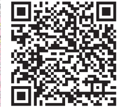
Digitale Karte für Ihr Smartphone

1. Weinhandlung und Kellerei Jakob Antwerpen Rheinstraße 218 53332 Bornheim-Hersel Tel. 02222/8884 www.jakobantwerpen.de